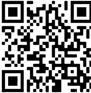
Vaihingen an der Enz